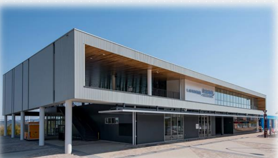
施設(来島海峡サービスエリア)の外観