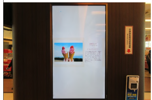
タブロイド誌「せとうちグルメ通信」（イメージ）