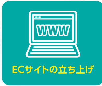
ECサイトの立ち上げ