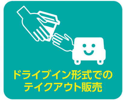
ドライブイン形式での テイクアウト販売