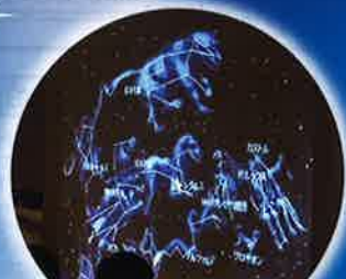
曇天時は、映像を使ったプログラムを行います